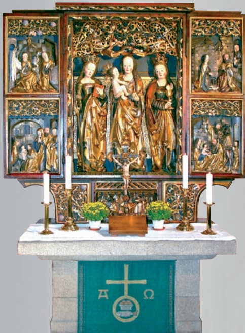
Ein Schatzkästchen in Hof - Die Hospitalkirche

Durch den Beitrag vieler kann so eine große Aufgabe gemeistert werden.