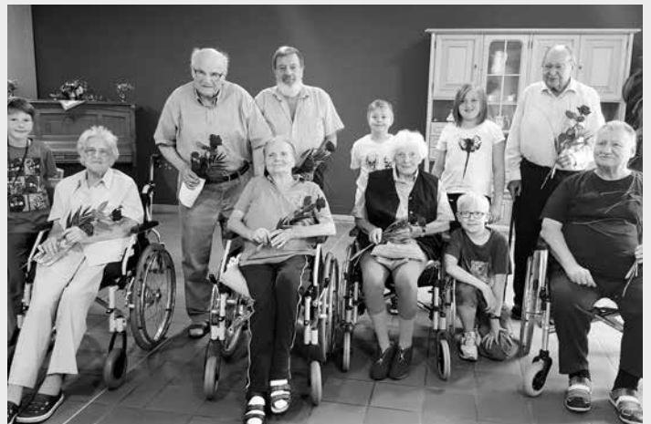
Vor den Sommerferien kamen Kinder und Senioren aus dem Lesepatentenprojekt von Diakonie und Neustädter Schule noch einmal zusammen.

meinsam das vergangene Schuljahr zu reflektieren. Es wurde über Urlaubsziele, Ferienpläne und auch das kommende Schuljahr gesprochen. Bei einer lockeren und heiteren Atmosphäre entstand ein toller Austausch zwischen Jung und Alt.