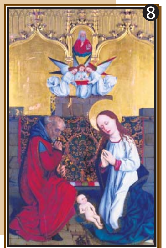
1 Christus am Ölberg; 2 Kreuzigung; 3 Kreuzabnahme; 4 Auferstehung; 5 der Erzengel Michael, der Namensgeber der Hofer Michaeliskirche, besiegt die Dämonen; 6 Verkündigung Maria; 7 die Apostel Bartholomäus und Jakobus; 8 Geburt Christi.