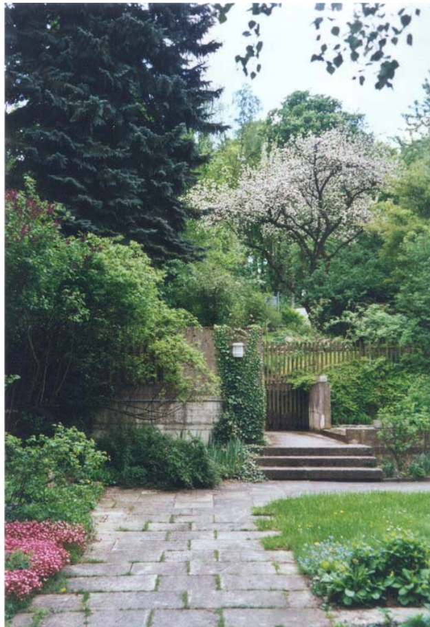
Blick auf einen Pfarrgarten an der Zeppelinstraße

Diese Nutzungskategorie umfaßt Pfarrgärten bzw. gartenartige Anlagen an Pfarrämtern, z.T. auch an Verwaltungsgebäuden, Hausmeistergärten und Reihenhaugärten, die i.d.R. zum Aufenthalt, zum geringen Teil auch als Wirtschaftsgarten genutzt werden. Im Einzelfall sind hier räumliche Überschneidungen und Übergänge zu anderen Nutzungstypen gegeben. Deshalb sind auch einzelne der Gärten in den Aufnahmebögen gemeinsam mit einer anderen Nutzungskategorie erfaßt.