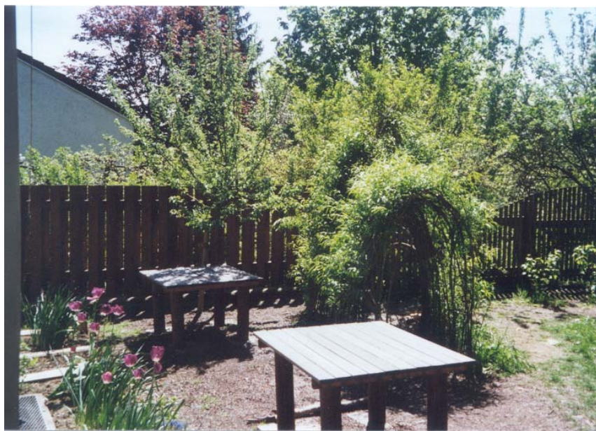
Weidentunnel und Kinderecke im Kindergarten Friedrich- Rückert-Straße

Je nach spezifischer Situation, Größe der Anlage, Alter usw. liegen bei den einzelnen Kindergärten unterschiedliche Verhältnisse vor (teils junge Anlagen, teils ältere, teils steht Neuplanung bevor, teils beengte räumliche Verhältnisse, teils großzügigere Anlagen). Dementsprechend individuell und verschieden sind auch die speziellen Situationen und Probleme bzw. die Wünsche der Nutzer für die Freianlagen.