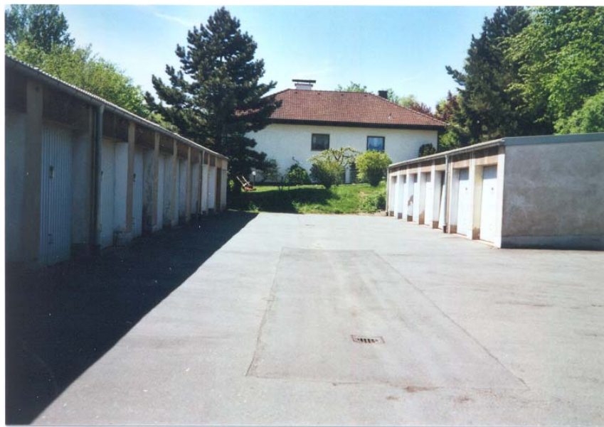
Garagenhof an der Ernst- Reuther- Straße

Die Freiflächen an den Wohnanlagen Ernst-Reuter-Straße umfassen neben Grünanlagen aus Rasen, Strauch- und Baumbeständen Garagenhöfe, Zufahrtsstraßen, Wege, Parkplätze u.a.. Z.T. sind die Garagenhöfe relativ großzügig bemessen und nur teilweise ein-