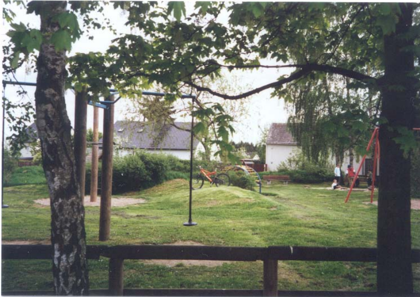
Spielplatz im Ortsteil Jägersruh

Auf kirchlichen Grundstücken befinden sich zwei Spielplätze, einer davon in Wölbattendorf (Flurnr. 669/8, Gemarkung Wölbattendorf, Evang.-Luth. Gesamtkirchenverwaltung, Nr.11b), der andere im Ortsteil Jägersruh (Flurnr. 579, Gemarkung Leimitz, Evang.-Luth. Kirchengemeinde St. Johannes, Nr. 13a). Beide Plätze wirken vergleichsweise vielfältig gestaltet mit Rasenflächen, kleinen Geländeerhebungen/bewegtem Gelände, Spielgeräten, Holzhäuschen, jungen Gehölzpflanzungen aus Sträuchern und einzelnen Bäumen wie Weißdorn, Hasel, Felsenbirne, Hartriegel, Rose, Forsythie, Spierstrauch, Weide, Kiefer, Linde, Kastanie, Vogelbeere, Kirsche und Birke (überwiegend einheimische, aber auch fremdländische Gehölze). Alter Baumbestand findet sich vor allem in den Randzonen. Auf Teilbereichen werden Wiesenstücke seltener gemäht, so daß sich hier ein Nebeneinander von intensiver und extensiver gepflegten Flächen ergibt. Versiegelte Wege u.ä. sind nicht vorhanden.