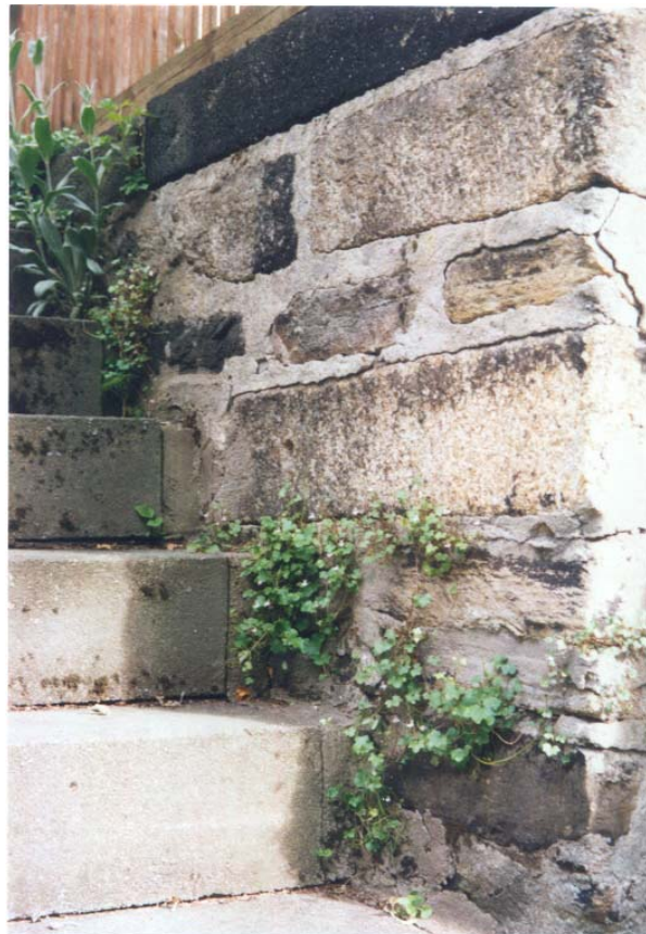
Zimbelkraut in den Mauerfugen

In einigen Gärten sind naturnahe Elemente oder Kleinstrukturen vorhanden wie Säume mit Wildstauden (z.B. Gierschsäume), gelegentlich auch Trockenmauern, Reisig- oder Laubhäufen sowie Kleingewässer u.a. Zum Teil werden auch Brennesselfluren als Biotope belassen, Obstbaumbestände angelegt oder Grasfluren als höherwüchsige, extensive Wiesenbestände gepflegt (durch zweimalige Mahd / Jahr mit der Sense). Positive Beispiele dafür sind z.B. Gärten in der Ritter-von-Münch-Straße, der von-Mann-Straße oder der Ölsnitzer Straße. So lassen Gärten manchmal auch das Interesse an ökologischen Fragen, die Freude an der Natur und das Umweltbewußtsein der Gartenbesitzer deutlich erkennen.