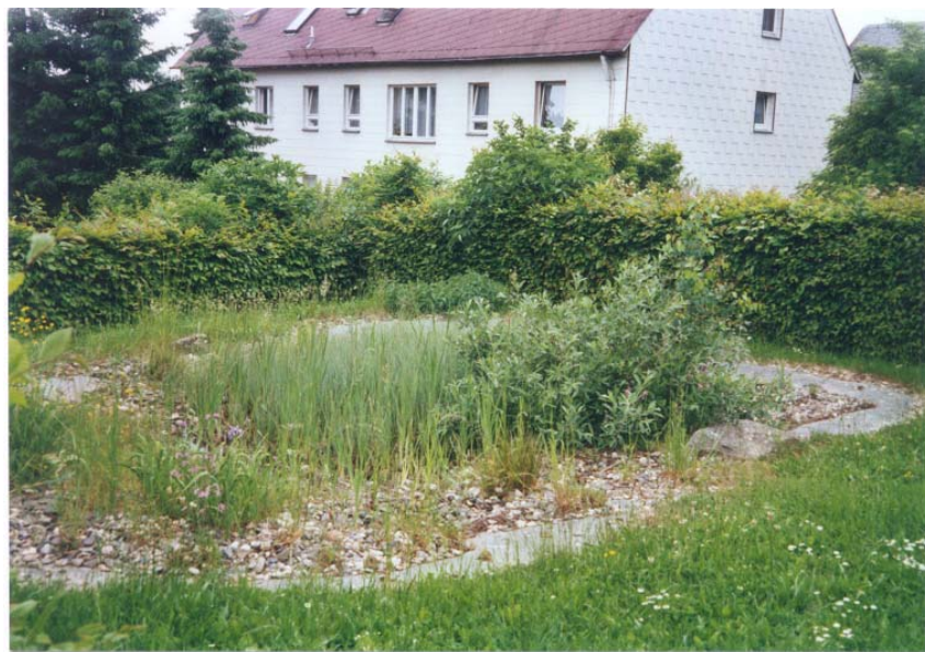
Feuchtbiotop im Kindergarten Birkenweg

Die Bepflanzung besteht meist aus einer Mischung von einheimischen und fremdländischen Gehölzen (wie z.B. Roßkastanie, Winterlinde, Hasel, Obst, Beerensträucher, Birke, Weide, Hainbuche, Bergahorn, Feldahorn, Holunder, Schwarzkiefer, Forsythie, Hartriegel, Blasenspiere, Kolkwitzie, Scheinzypresse, Falscher Jasmin). Teils ist alter Baumbestand vorhanden, teils handelt es sich um eher offene, gehölzarme Anlagen oder junge Pflanzungen. In einzelnen Fällen wäre eine Bereicherung durch Bäume, Gebüsche, Obstbäume u.ä. wünschenswert, was oft auch von den Nutzern/Ansprechpartnern so empfunden wird, aber derzeit z.B. an finanziellen Restriktionen scheitert.