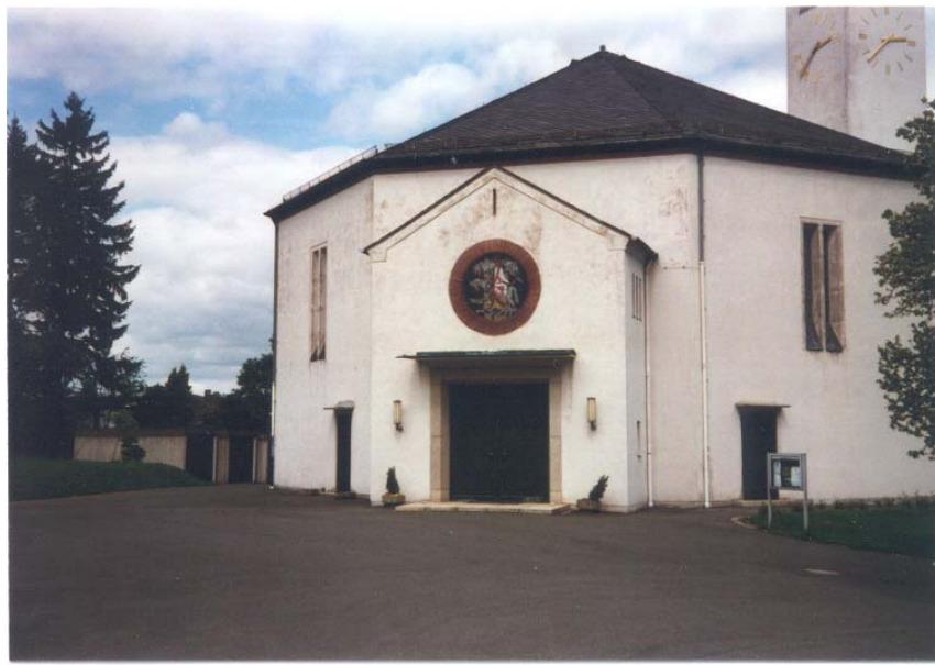
Asphaltierte Flächen und Pflanztröge am Kirchvorplatz (Lutherkirche)

Andere Anlagen zeigen ein naturnäheres Erscheinungsbild mit zurückhaltender Versiegelung oder altem Laubgehölzbestand wie z.B. der Park bei der Lorenzkirche.