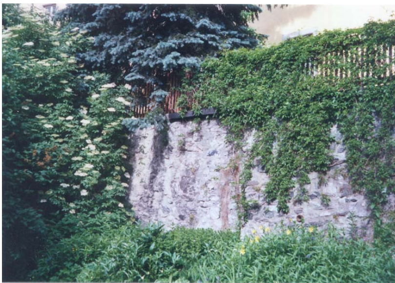
Klettergehölze "erobern" Mauern und Zäune in ei- nem Garten am Maxplatz