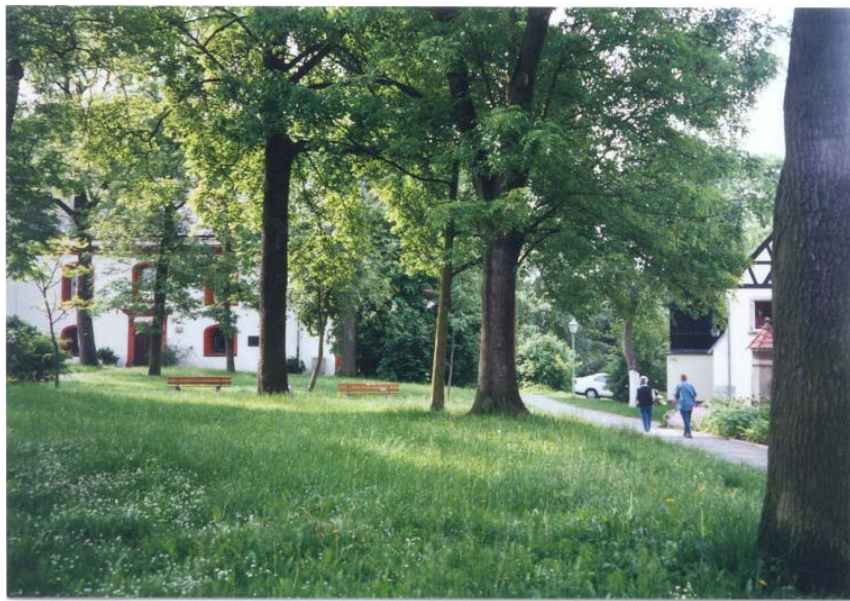
Park an der Altenbegegnungsstätte / Lorenzkirche

Andere Anlagen zeigen ein naturnäheres Erscheinungsbild mit zurückhaltender Versiegelung oder altem Laubgehölzbestand wie z.B. der Park bei der Lorenzkirche.