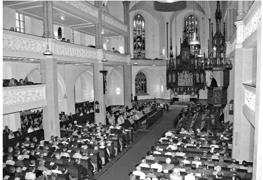
Nach Gesprächen mit den KirchenvorsteherInnen von Köditz und der Hofer Kreuzkirche zum Thema "Wie teilt man einen Pfarrer?" oder "Gespräch über kombinierte Pfarrstellen" und dem Besuch der Sophienschule in Hof war der Festgottesdienst in St. Michaelis Abschluss des ersten Besuchstages (siehe Bild oben). Die St. Michaeliskantorei, der CVJM-Posaunenchor und die DELFJ-Band von St. Johannes bewiesen wie gut die verschiedenen Musikstile harmonieren können. Die Predigt hielt Landesbischof Friedrich (nachzulesen unter www.dekanat-hof.de unter "Predigt").

meindglieder hat sich in den letzten Jahren nicht verändert. Die Ansprüche an Pfarrer von außen und an sich selbst seien jedoch gestiegen. Einige Ideen, wie Pfarrer entlastet werden können, nimmt er aus dem Dekanat nach München mit. Er betont, dass ein weiterer Abbau des Pfarramtspersonals aus Kostengründen, v. a. die Reduktion von Arbeitsstunden der Pfarramtssekretärinnen, nicht weiter voranschreiten darf.