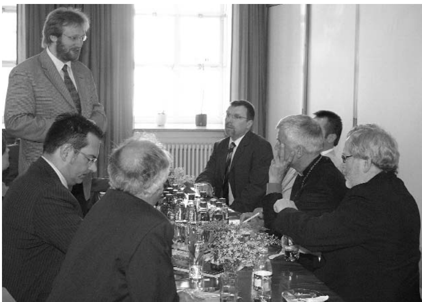
Bild oben: Beim Mittagessen im Gemeindehaus St. Michaelis hatte der Landesbischof Gelegenheit, die PfarrerInnen des Dekanats kennen zu lernen. Tischgespräche waren: Entlastung der Pfarrer, Konfirmandenunterricht am Mittwochnachmittag und Baulast bei Pfarrhäusern.