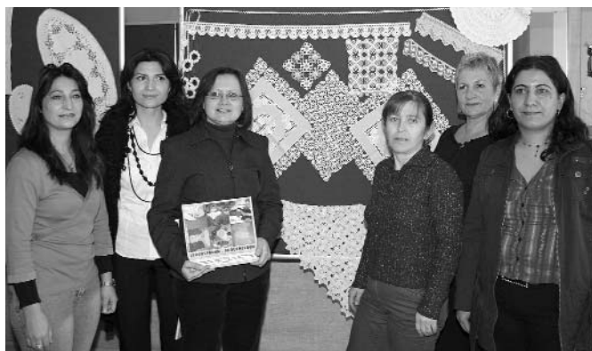
Bild: Die Autorinnen stellen ihr Buch der Presse in den Räumen der EJSA, Königstraße 36, vor. Stolz zeigen sie ihre Handarbeitsstücke vor.

beiten nicht nur für türkische Mädchen. Viele Mädchen verschiedener Nationalitäten stellen ihre Aussteuer immer noch selbst her. So entstand die Idee über die Handarbeiten diese Frauen ins Gespräch zu bringen. Das Buch "Lebensfäden - Frauenleben" ist ein Ergebnis dieses Projektes des Internationalen Mädchen- und Frauenzentrums. Sie erhalten das Buch für 5 Euro in der EJSA, Königstr. 36, oder im Kirchengemeindeamt, Maxplatz 1 in Hof. kb