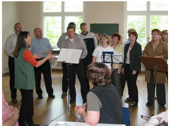
Bild oben: Der neugegründete "Gospelchor ohne Namen" der Lutherkirche verabschiedete die Gäste mit einer Darbietung.