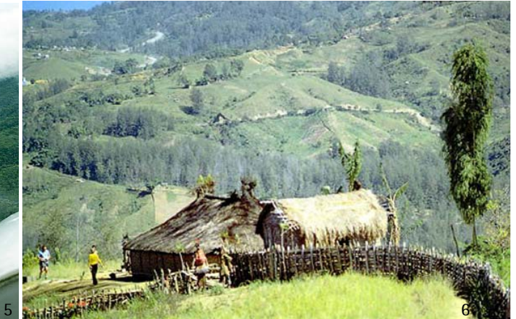
Bild oben: Diesen Ausblick hat Volkher Jacobsen täglich bei seiner Arbeit: Papua-Neuguinea ist keine flache Insel. Von West nach Ost erstreckt sich ein hohes zentrales Gebirge mit Höhen bis über 5000 Meter ü. NN.