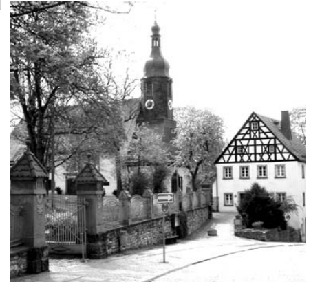
Bild oben: Die ABS ist im alten Kantoratsgebäude in der Lorenzstrasse 47 - gleich neben der Lorenz-kirche - untergebracht.

Pro Woche finden sich zu den verschiedenen Veranstaltungen zwischen 60 und 100 SeniorInnen ein. Die Treffen in der ABS sind für die SeniorInnen nicht nur eine Möglichkeit, ihren Nachmittag in netter Gesellschaft zu verbringen, oft bilden sich Freundschaften über die ABS hinaus. Die BesucherInnen kommen aus dem gesamten Stadtgebiet und sogar aus dem Umland, um an dem bunten Programm teilzunehmen.