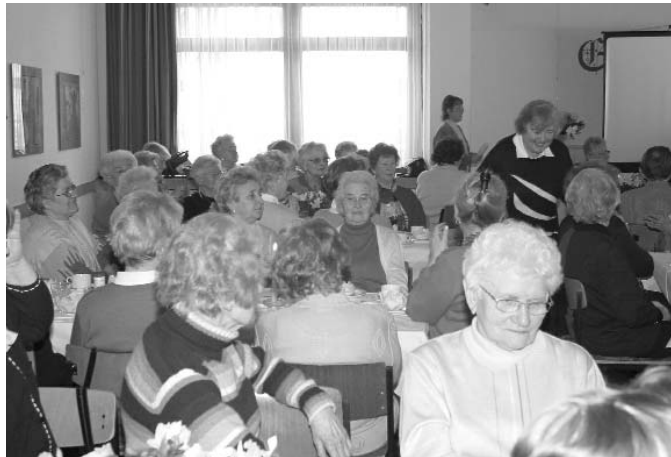
Bild oben: Viele wollten die Geburtstagsfeier anlässlich des 15-jährigen Bestehens der Altenbegegnungsstätte St. Lorenz nicht verpassen.