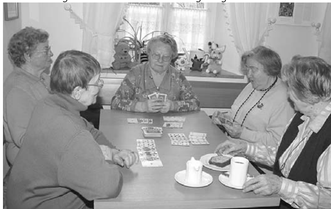
Bild oben: Schauen Sie doch mal in der ABS vorbei - zum Beispiel am Freitag zum Spielenachmittag!

Jeder, der einmal in der ABS vorbeischauen oder auch mit-helfen will, ist herzlich willkommen. Die ABS in der Lorenzstr. 47 ist täglich von 13.30 bis 17.00 Uhr geöffnet. Natürlich muss man nicht den ganzen Nachmittag da sein - jeder darf kommen und gehen, wann er will. Ist an einem Tag ein Ausflug geplant, ist die ABS jedoch geschlossen. Für die Ausflüge besteht Anmeldepflicht, damit eine bessere Planung möglich ist.